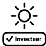
2. KIES EEN BEDRAG