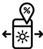
1. KIES EEN PROJECT

ZPD Zonfonds zorgt voor de verstrekking van het vreemde vermogen naast de andere vermogensdelen.